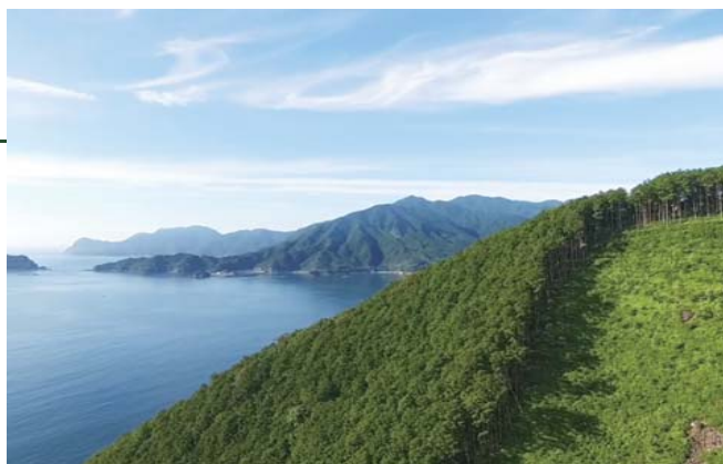
面向熊野滩的扁柏林

从这个山区到沿海地带的距离大约为10~15km，坡面倾斜度非常大，从沿海地带到陡坡的山顶种植着壮观的扁柏，这一景色在全国也很罕见，形成了出色的地貌景观。