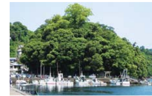
有鱼的森林保护区