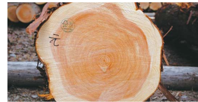
尾鹫扁柏细腻的年轮

在三重县立熊古道中心的建设中，使用了6,549根尾鹫扁柏的支柱木材，所有这些木材都进行了弯曲法杨氏模量的测量。结果，科学地证明了该地区出产的扁柏在强度性能等材质方面非常出色。