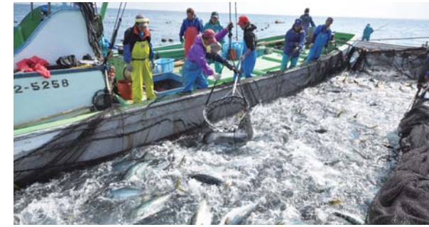
用定置网捕获鲷鱼

三重县尾鹫市纪北町是与大台山脉相连的陡峭山岳地带，因此不适合种植水稻，自古以来林业发达，并在1630年前后开始了人工造林。此外，这里是年均降水量3,800mm以上的多雨地区，而且土地大多贫瘠，适合这种自然条件的扁柏的种植在宽永年间（1850）以后盛行起来，现在，扁柏占人工林的90%，形成了日本前所未有的扁柏造林区。在该地区，人们将土地贫瘠生长缓慢这种不利条件转化为优势，通过密集栽种树苗并反复疏伐，在生产出高质量扁柏的同时，人们很早就意识到森林与海洋之间的关系，开展了考虑到生物多样性的森林管理。此外，扁柏林沿着面向里亚式海岸的陡坡和世界遗产“熊野古道”沿线扩展，形成了该地区特有的景观。经营这种地区独特的传统林业得到了赞赏，并于2017年3月被认定为日本农业遗产。