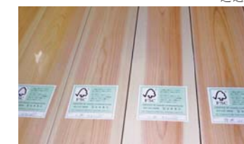
尾鹫扁柏支柱材料